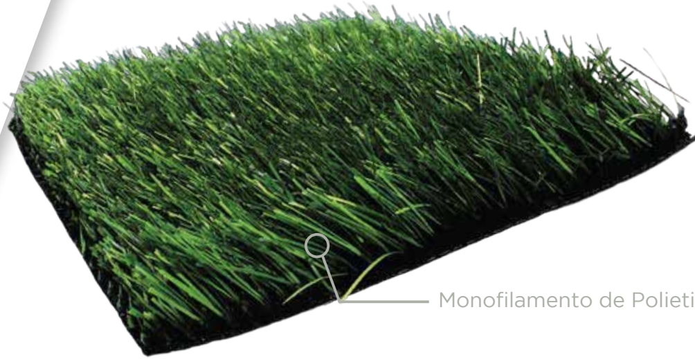
Monofilamento de Polietileno